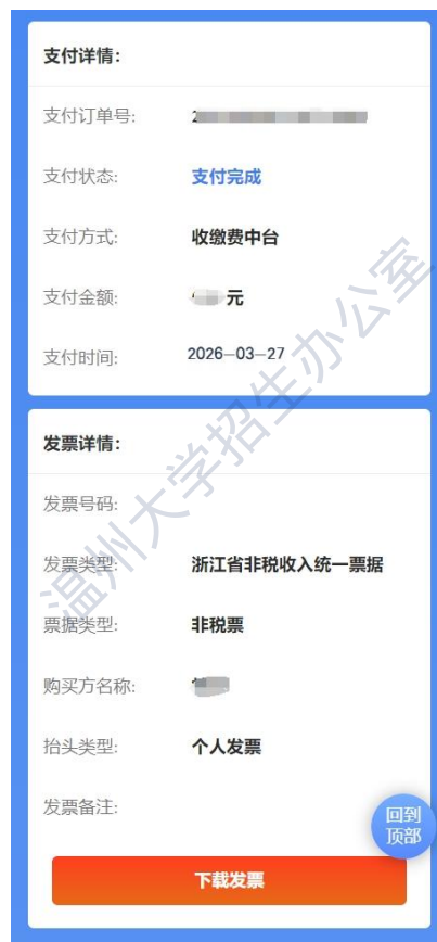
图 7 缴费状态查询

四、 查询缴费状态 。缴费完成后，重新登录缴费系统，输入身份证号或缴款单号查询，支付状态为“支付完成”即完成缴费（图 7）。 缴费状态可能存在延迟，建议支付完成 5 分钟后再查询。